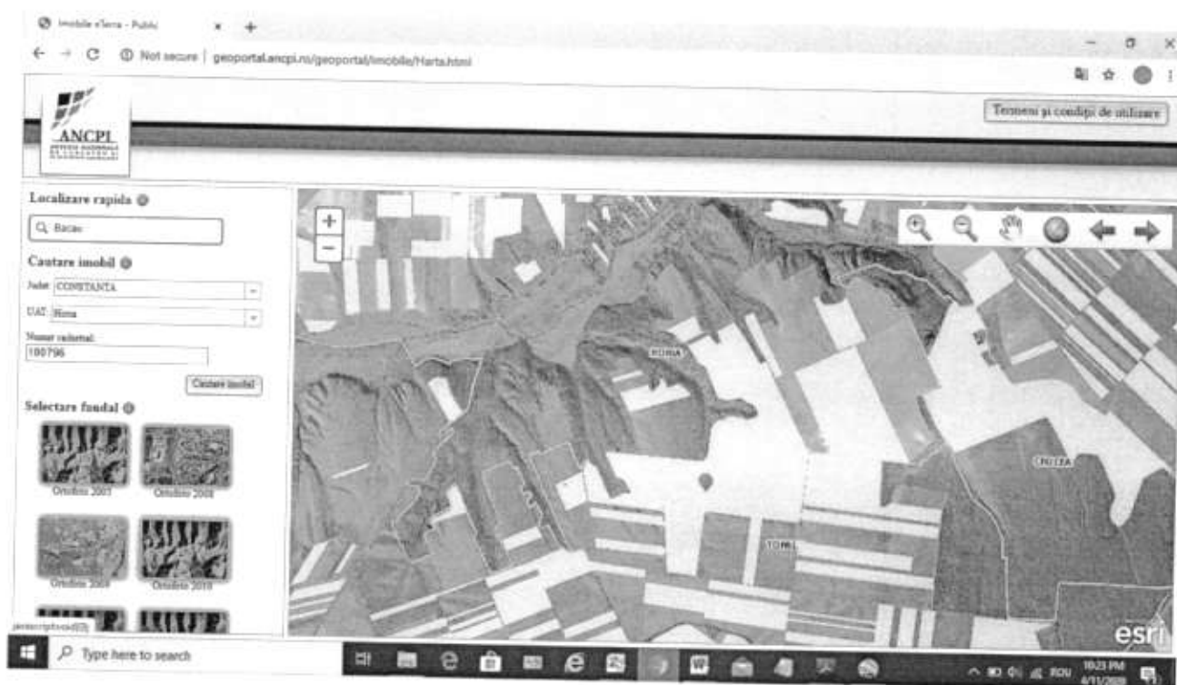
Fig. 1 Amplasamentul investiției

e) planșe reprezentând limitele amplasamentului proiectului, inclusiv orice suprafață de teren solicitată pentru a fi folosită temporar (planuri de situație și amplasamente);