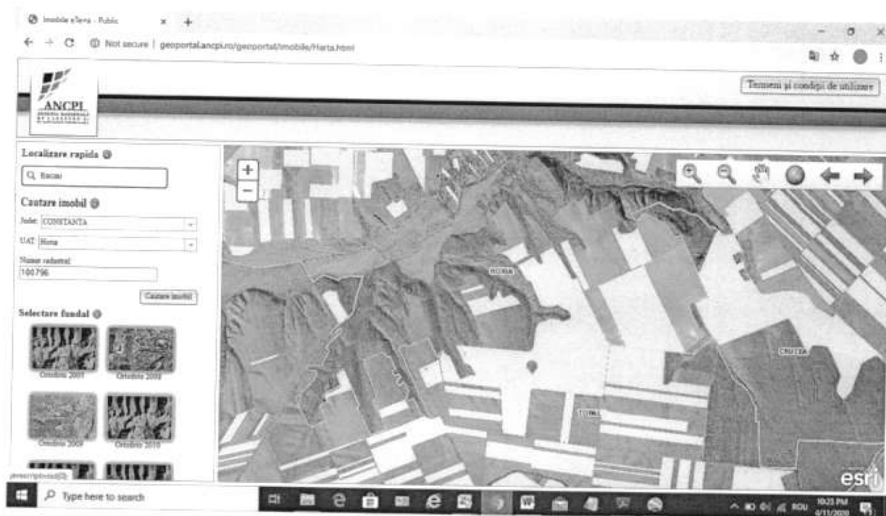
Fig. 1 Amplasamentul investiției

politici de zonare și de folosire a terenului; arealele sensibile;